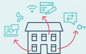
Smart Home & Building Integration

Für Verwalter, Eigentümer, Mieter & Immobiliendienstleister.