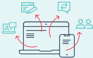
Service-App & Kundenportal